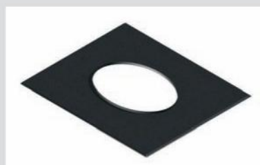
Katuse aluskatte läbiviik