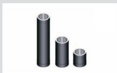
Sirged korstna- moodulid 0,25m 0,5m 1m