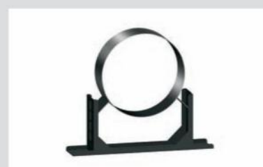
Reguleeritav seinakinnitus- klamber