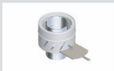
Õhukanalitega suitsusiiber Patent nr. FI 9582