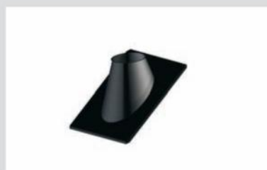
Katuse läbiviik 5-30°, 35-45° või lamekatust